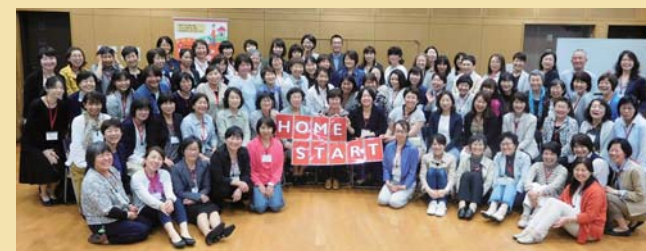
オーガナイザー同士の学び合いで自信も気力も充実！