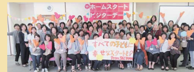
ホームスタートの活動は自分自身も元気になれる機会がたくさん！