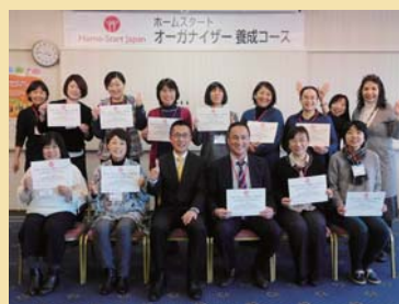
HSオーガナイザー養成コース（3日間） 3回開催・36名養成